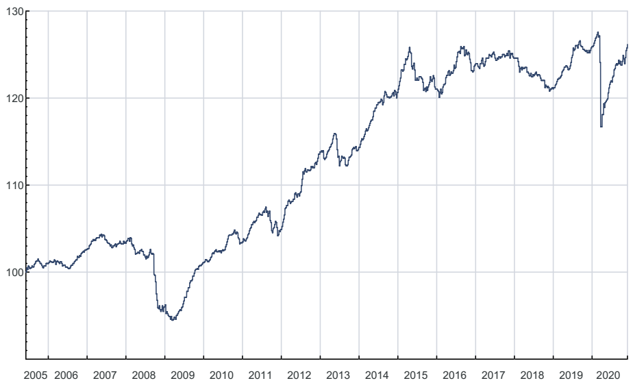
■ VKB-Anlage-Mix Classic - R01 EUR DIS

Marketingmitteilung: Bei diesen Informationen handelt es sich um eine Marketingmitteilung, die von der Volkskreditbank AG ausschließlich zu Informationszwecken erstellt wurde. Diese Informationen sind unverbindlich und stellen weder eine Empfehlung zum Kauf oder Verkauf noch eine Finanzanalyse oder Beratungsleistung, ein Angebot oder eine Einladung zur Angebotsstellung zum Kauf oder Verkauf von Wertpapieren dar, noch ersetzen sie ein persönliches Beratungsgespräch mit einem Anlage- und Steuerberater. Jede Anlageentscheidung bedarf der individuellen Abstimmung auf die persönlichen und steuerrechtlichen Verhältnisse und Bedürfnisse des Anlegers.