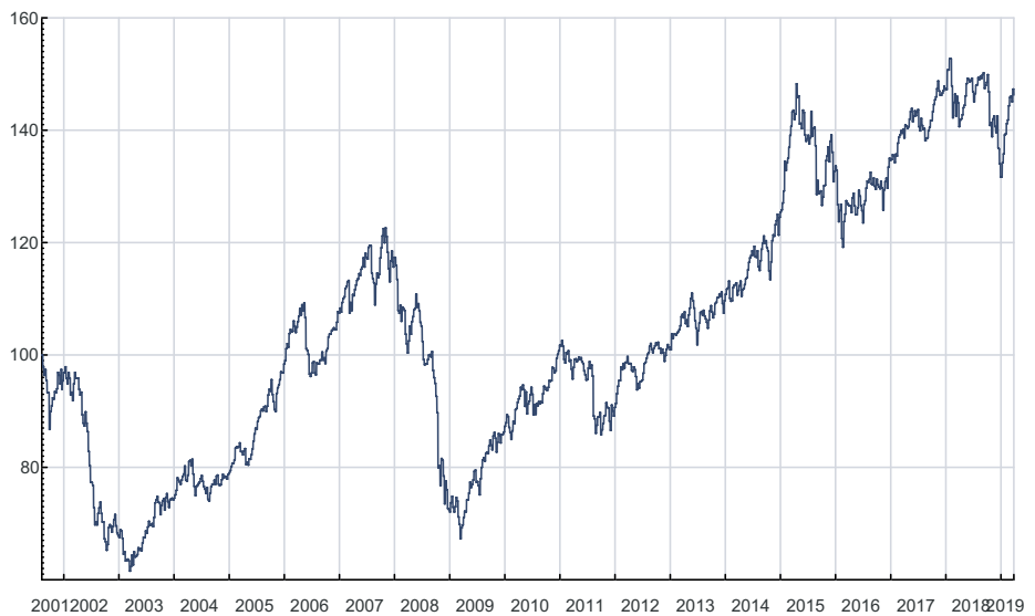
VKB-Anlage-Mix im Trend - EUR ACC